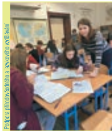
Podpora přírodovědného a jazykového vzdělávání

V únoru a v březnu jsme na naší škole postupně přivítali žáky 13. ZŠ, 26. ZŠ, Církevní střední a ZŠ, žáky Gymnázia L. Píka a Gymnázia FK a ZŠ s.r.o. na projektových dnech v rámci spolupráce na projektu „Podpora přírodovědného a jazykového vzdělávání na CG Plzeň včetně zajištění bezbariérovosti“ uskutečňovaného v rámci IROP. V nově vybavených odborných učebnách se žáci věnovali aktivitám v angličtině pod vedením rodič mluvčí, pracovali v chemické laboratoři, pod mikroskopem zkoumali plazmolýzu a deplazmolýzu buřky a ve skupinách v zeměpisném bloku řešili problematiku produktů Fair Trade. Celkem se na naší škole zúčastnilo těchto dnů kolem 130 žáků ze sprátených škol.