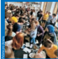
Pečeme pro Ukrajinu