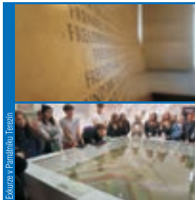
Exkurze v Památníku Terezi