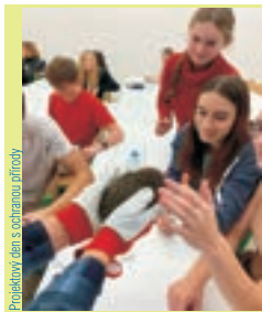
Projektový den s ochranou přírody