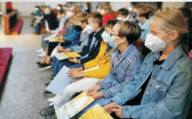
Církevní gymnázium v Plzni - zahájení školního roku

Posláním Církevního gymnázia Plzeň je poskytovat kvalitní všeobecné vzdělání, které je zakořeněné v křesťanské tradici, respektuje osobnost studenta a je otevřené celoevropské perspektivě.