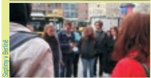
Septimy v Berlíně