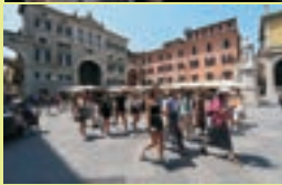
Poznávací exkurze do Itálie