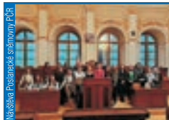
Návštěva Poslanecké sněmovny PČR

se letos nemohla uskutečnit v prezenční formě, proto žáci vánoční vystoupení natočili v katedrále sv. Bartoloměje a záznam poskytli veřejnosti na stránkách CG.