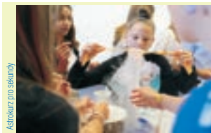
Astrokurz pro sekundy