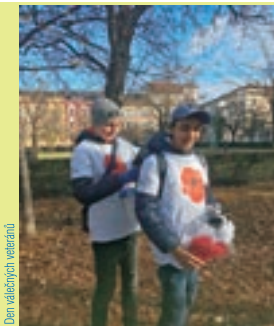
Den válečných veteránů

V sobotu 20. listopadu 2021 se od 14 00 hodin zpřístupnila on-line aplikace, kde byla možnost si projít prezentace jednotlivých předmětů, zahrát si hry, luštit kvízy, podívat se na videa a fotografie.