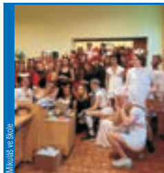
Mladší ve škole