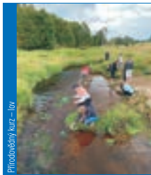
Přírodovědný kurz – lov

– o situaci na blízkém východě se zvláštním zaměřením na Afghánistán