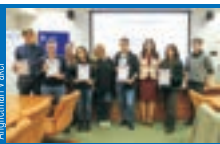
Angličtinař v akci