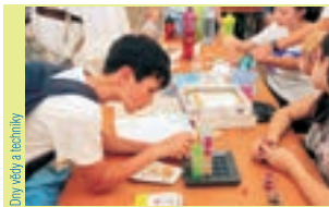
Dny vědy a techniky