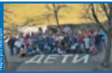
Nápis pro Marupol