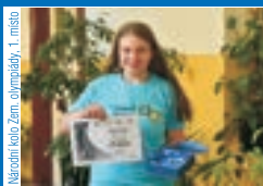
Národní kolo Zem. olympiády, 1. místo

O Zeměpisnou olympiádu je mezi žáky stále vysoký zájem. Každoročně se soutěže od školního po celostátní kolo účastní přibližně 10 000 žáků základních a 4 500 žáků středních škol. Nezřídka se právě z úspěšných řešitelů s vynikajícími výsledky stávají studenti geografie na vysokých školách v Česku i zahraničí.