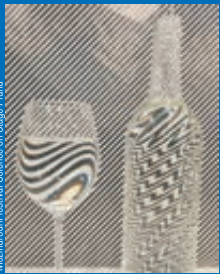
Mezinárodní festival Science on Stage Praha