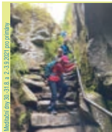
Meditační dny 30.-31. a 2.-3.9.2021, pro primáry

Tradiční letní tábor pro studenty CG, který využívá tábořiště Českého svazu ochránců přírody u Nepomuka. Hlavním záměrem desetidenního setkáání žáků různých tříd je upevnění třídního kolektivu napříč ročníky, rozvinutí znalostí angličtiny a získání zájmových dovedností.