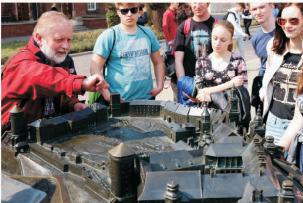
Exkurze do Polska