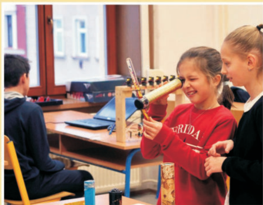
Odpoledne plné překvapení