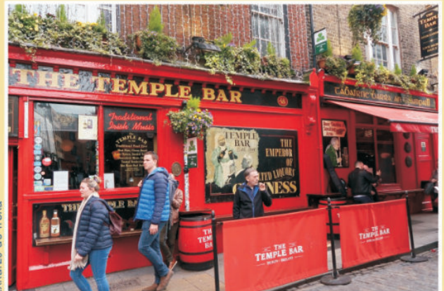
Exkurze do Irska