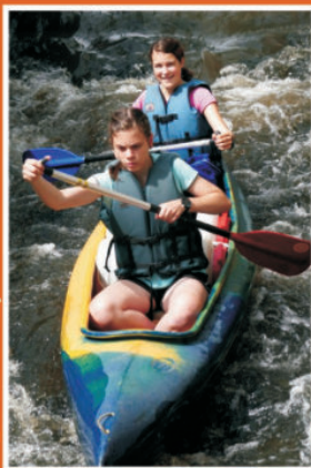
Kurz vodní turistiky