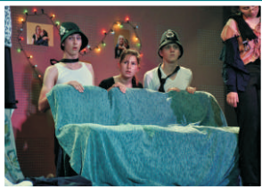
Nastudování divadelní hry „Blbec k večer“