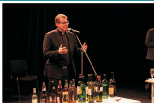
Moving Station - 25. výročí školy