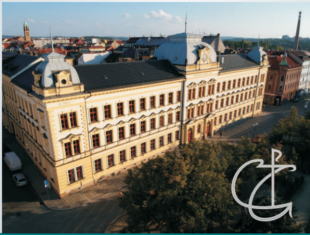
budova Církevního gymnázia Plzeň