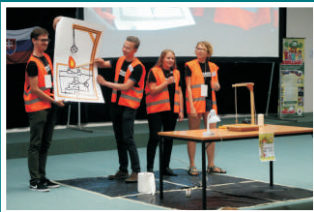
Pohár vědy 2013