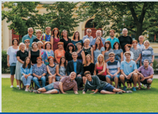
Pedagogický zbor Gáborvillovej gymnáziá v Pízeri