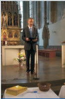
Předávání maturitních vysvědčení 2017