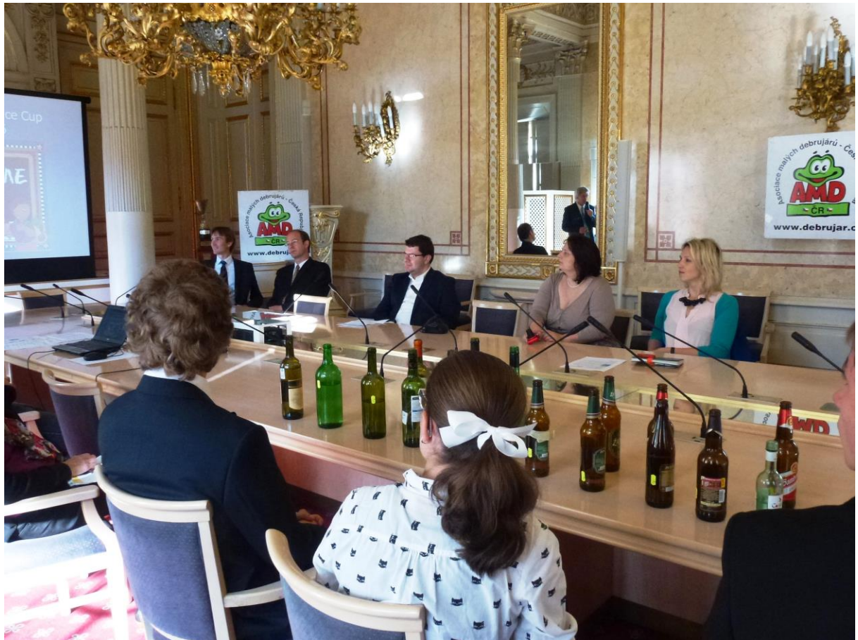
Soutěž Pohár vědy na MŠMT