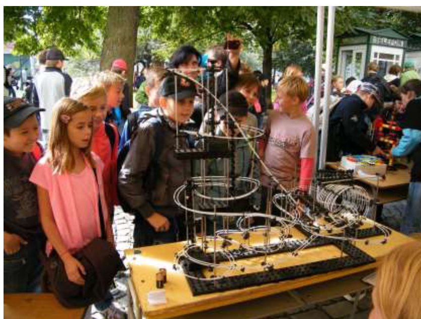
Dny vědy a techniky – studenti předvádějí kuličkovou dráhu.

V září jsme také předváděli zbrusu nové kuličkové dráhy vlastní výroby, laserové i magnetické hry, hru na vodovodní trubky a další atrakce z naší „fyzikální dílny“. To vše v rámci naší školní expozice na Dnech vědy a techniky v Plzni a samozřejmě za doprovodu dnes již slavného školního Komorního lahvového orchestru, tentokrát ve výrazně omlazené sestavě.