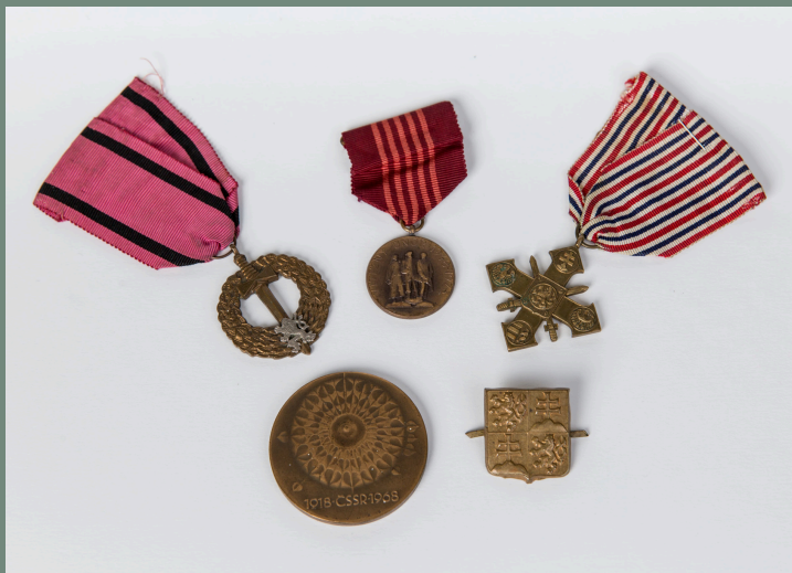
Československý válečný kříž 1939, Pamětní medaile Československé armády v zahraničí, Dukelská pamětní medaile, vystaveno v Muzeu romské kultury v Brně