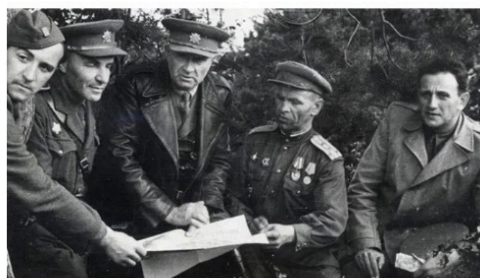
Bitva o Dukelský průsmyk (Ilustrační FOTO)

Markus Pape 21. února 2017 Čtení na 2 minuty Read in English